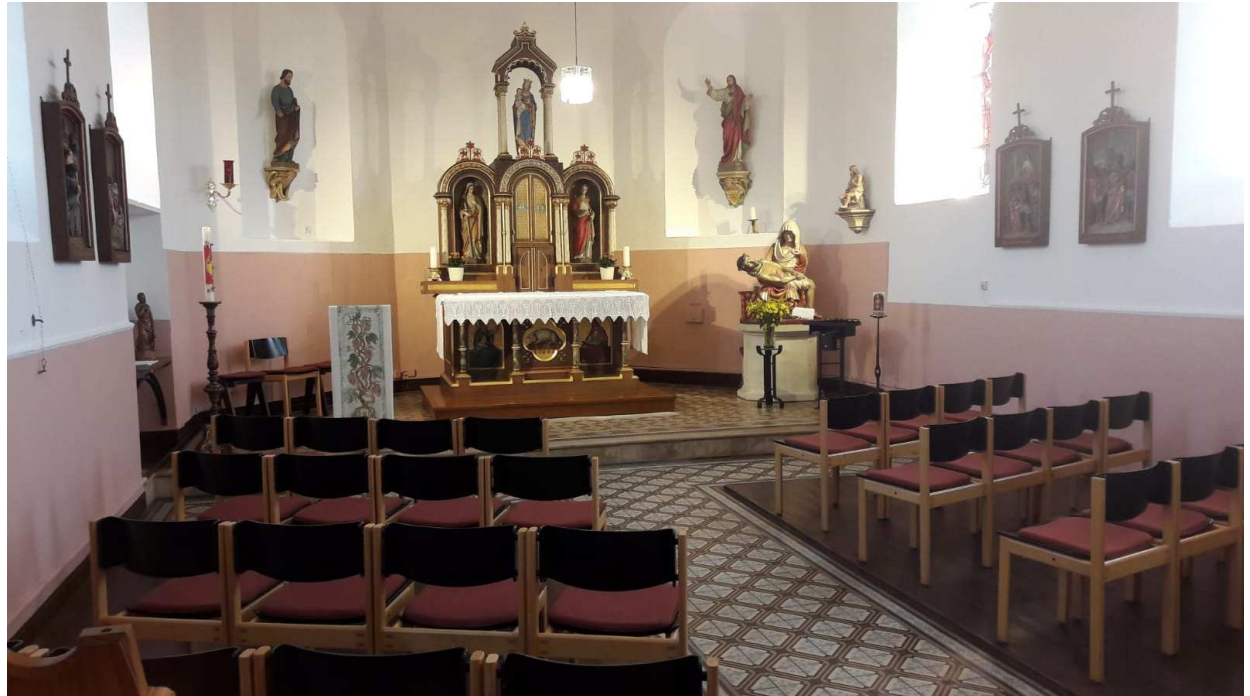
Blick auf den Chorraum mit Altar und spätgotischem Vesperbild der schmerzhaften Maria

Aus dem frühen 15. Jahrhundert stammt ein hölzernes Vesperbild der schmerz erfüllten Maria mit dem Leichnam ihres Sohnes, das vermutlich erst nach der Säkularisation von St. Matthias nach Filsch gelangte.